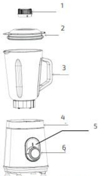
Fig./Img./Abb./Afb./ Rys./Obr. 1