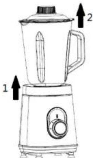
Fig./Img./Abb./Afb./ Rys./Obr. 3