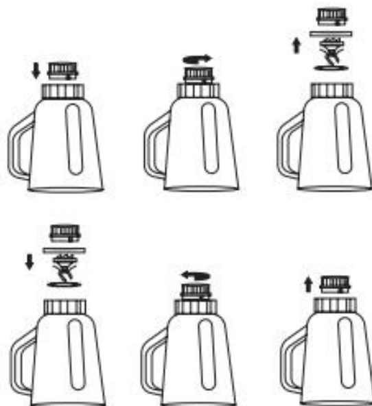
Fig./Img./Abb./Afb./ Rys./Obr. 4