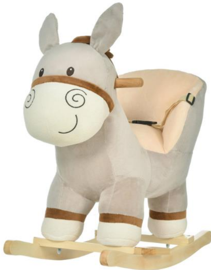
Παιδικό Κουνιστό Γαϊδουράκι