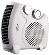
Diet Kitech Scale AD 3133