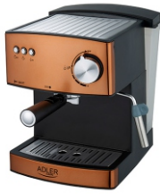
Espresso Machine AD 4404