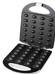
Nut Cookie Maker AD 3039