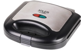
Sandwich maker AD 3015