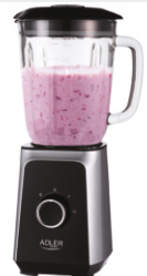
Blender AD 4076