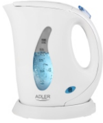
Electric Kettle AD 02