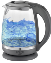
Kettle AD 1286