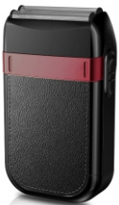
Hair Shaver AD 2932