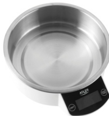
Kitchen Scale AD 8121