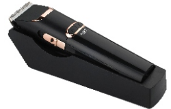
Hair Clipper AD 2832