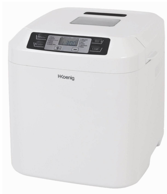
Αυτόματος Αρτοποιηστική 550 W H.Koenig BAKE320