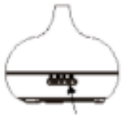
Fig./Img./Abb./Afb./ Rys./Obr. 6