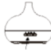
Fig./Img./Abb./Afb./ Rys./Obr. 7