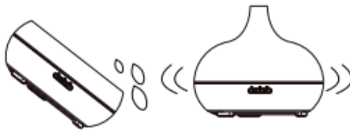
Fig./Img./Abb./Afb./ Rys./Obr. 8