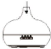
Fig./Img./Abb./Afb./ Rys./Obr. 5