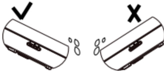
Fig./Img./Abb./Afb./ Rys./Obr. 9