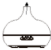
Fig./Img./Abb./Afb./ Rys./Obr. 2