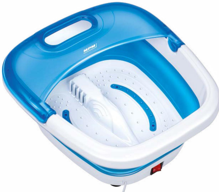
Μασάζ ποδιών MMS-04

ΟΔΗΓΙΕΣ ΑΣΦΑΛΕΙΑΣ: Διαβάστε προσεκτικά αυτό το εγχειρίδιο πριν χρησιμοποιήσετε τη συσκευή. Απαιτείται στενή επίβλεψη όταν χρησιμοποιείτε τη συσκευή κοντά σε παιδιά. Μην τοποθετείτε το καλώδιο πάνω από αιχμηρές άκρες και κρατήστε το μακριά από καυτές επιφάνειες. Μην χρησιμοποιείτε τη συσκευή εάν είναι κατεστραμμένη, επίσης εάν το καλώδιο τροφοδοσίας ή το φισ είναι κατεστραμμένο - επιστρέψτε τη συσκευή για επισκευή σε εξουσιοδοτημένο κέντρο σέρβις. Για να αποφύγετε τον κίνδυνο ζημιάς, πυρκαγιάς ή τραυματισμού, χρησιμοποιείτε πάντα τα εξαρτήματα που συνιστώνται από τον κατασκευαστή. Μην βυθίζετε τη συσκευή, το καλώδιο και το φισ της σε νερό ή άλλα υγρά - το καλώδιο ρεύματος και το φισ πρέπει να διατηρούνται πάντα στεγνά. Για μασάζ, τοποθετήστε τη συσκευή σε απόσταση τουλάχιστον 1 m από μπανιέρα ή ντους. Απενεργοποιείτε πάντα τη συσκευή πριν την αποσυνδέσετε από την πρίζα. Μην αφήνετε τη συσκευή λειτουργίας χωρίς επίβλεψη! Μην χρησιμοποιείτε τη συσκευή για σκοπούς